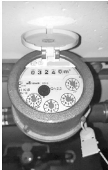
„Bitte lies mich regelmäßig ab!“

Vielen Dank für Ihr Verständnis und Ihre Mithilfe.