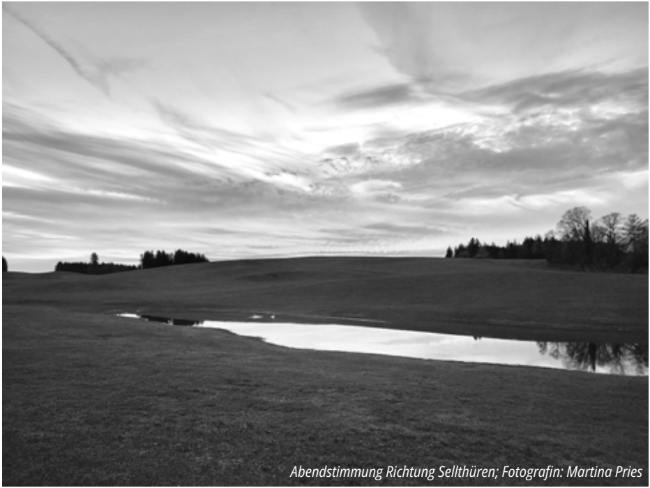
Abendstimmung Richtung Sellthüren