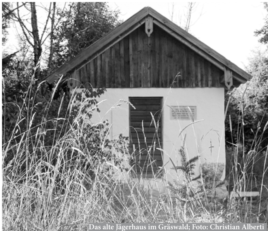
Das alte Jägerhaus im Gräswald