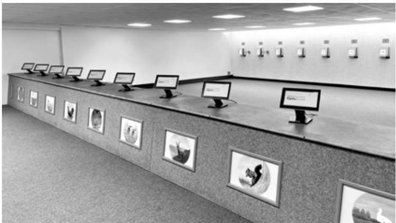
Elektronische Schießstände