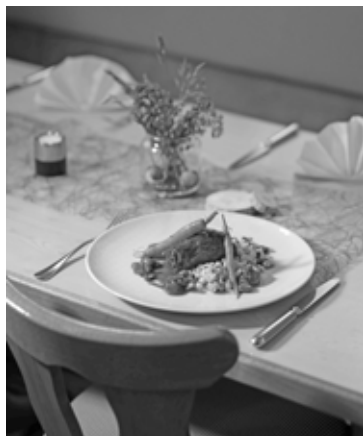
Gasthof Adler Frechenrieden, Marc Brugger

Aus der Fülle hochwertiger, regionaler Lebensmittel zaubern die teilnehmenden Gastronomen wäh-rend der Genusstage ganz besondere Gerichte. Gäste können sich von traditionellen Gerichten und kreativen Interpretationen überraschen lassen, die in urigen Wirtshäusern, gutbürgerlichen Gaststät-ten und in gehobenen Restaurants gereicht werden. Das Besondere: Interessierte erfahren direkt auf der Speisekarte, von welchem Landwirt oder handwerklichen Verarbeiter aus der Region die Lebens-mittel stammen.