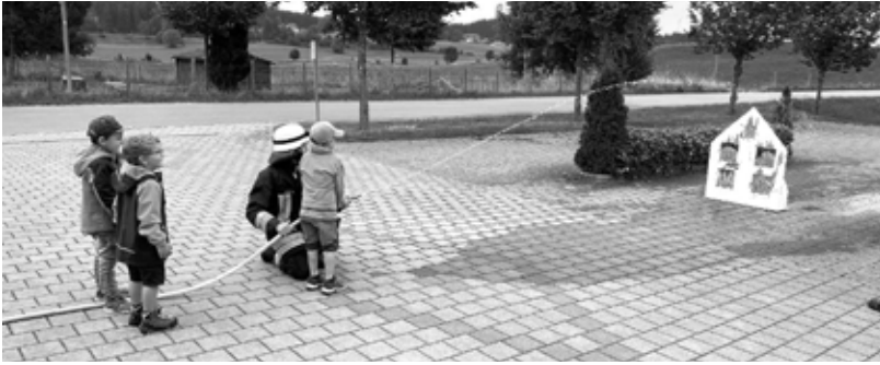
Löschen des Brandhauses