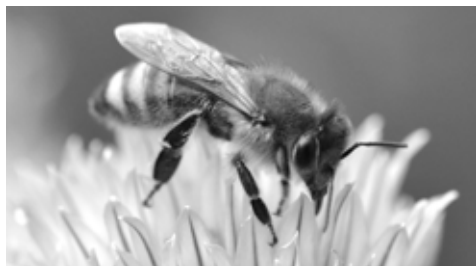
Aus der Blüte einer Schnittlauchpflanze sammelt eine Biene Nektar.

Imkern ist nach wie vor stark im Trend. Der Imkerverein Günstal zählt 138 Mitglieder und freut sich über zahlreiche neue Mitglieder, die er tatkräftig beim Start in die Imkerei unterstützt. Um eine gute Ausbildung anbieten zu können hat der Verein Anfang des Jahres einen Lehrbienenstand gegründet. Einmal pro Woche treffen sich hier die „Azubis“ mit erfahrenen Ausbildern, um die aktuell anstehenden Pflegearbeiten in Theorie und Praxis zu erlernen. Begleitend dazu besuchen sie die Kurse der Imkerschule Schwaben in Kaufbeuren-Kleinkemnat.