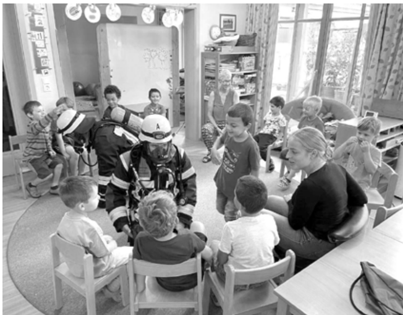
Feuerwehrleute ganz nah

Text und Fotos: Robert Müller Feuerwehr Obergünstach