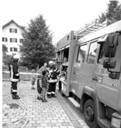
Besichtigung des Feuerwehrautos