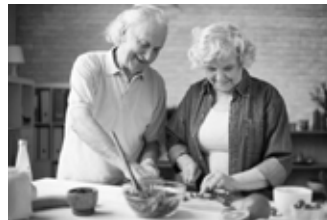
Generation 55plus.

Die Kosten übernimmt das Bayerische Staatsministerium für Ernährung, Landwirtschaft und Forsten.