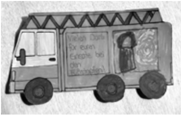
Geschenk für die Feuerwehrleute