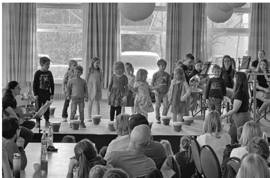
Auftritt der musikalischen Früherziehung „Musikflöhe“