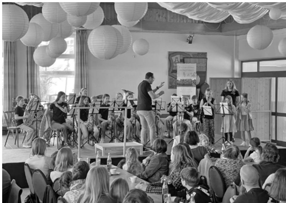
Die Notenflitzer übernahmen die musikalische Umrahmung.