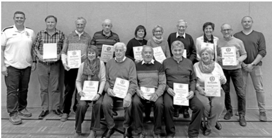
Zahlreiche Ehrungen standen auf der Mitgliederversammlung des TSV Günzach an